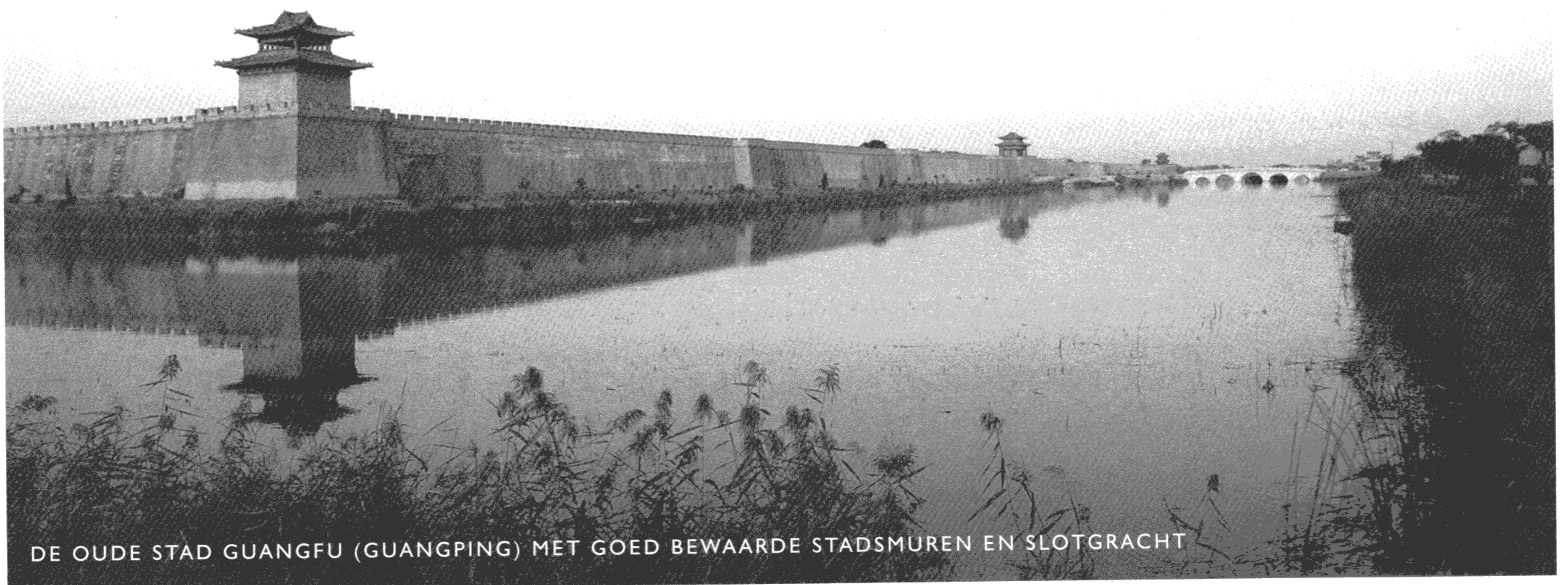
DE OUDE STAD GUANGFU (GUANGPING) MET GOED BEWAARDE STADSMUREN EN SLOTGRACHT